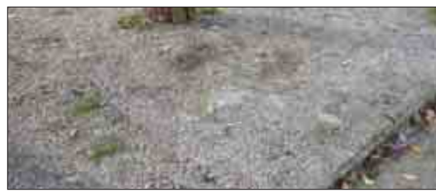
Il tombino dopo la rimozione della targa commemorativa usata come tappo. A PAGINA 17