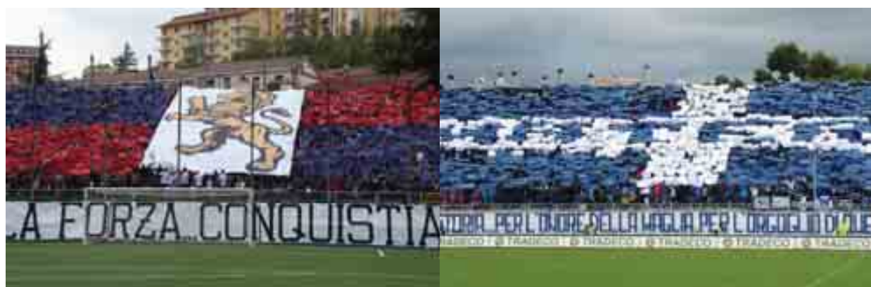
I tifosi del Potenza e del Matera. Al Viviani saranno in 5mila a colorare i gradoni del catino di viale Marconi