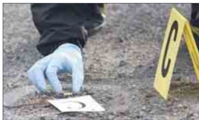
Nel triennio 2014-2017 omicidi in calo in Basilicata. A PAG. 7

Le tante tragedie del 2018 metteranno fine all'attuale trend positivo